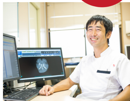
ニューロテックメディカル株式会社取締役社長 脳梗塞・脊髄損傷クリニック院長 日本脳卒中学会認定脳卒中専門医 日本リハビリテーション医学会認定専門医 日本リハビリテーション医学会認定指導医